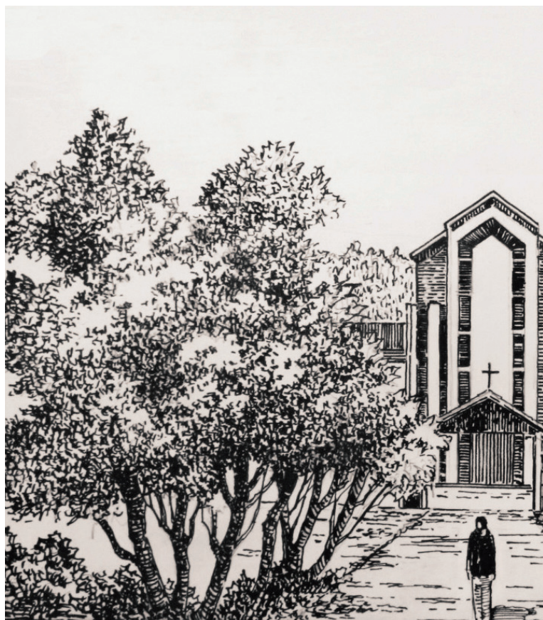
Dibujo del Seminario de Monay