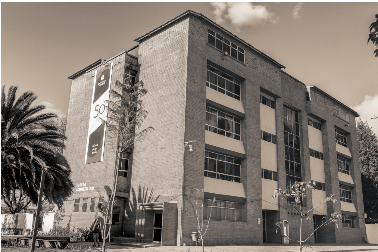
Edificio de la Facultad de Administración