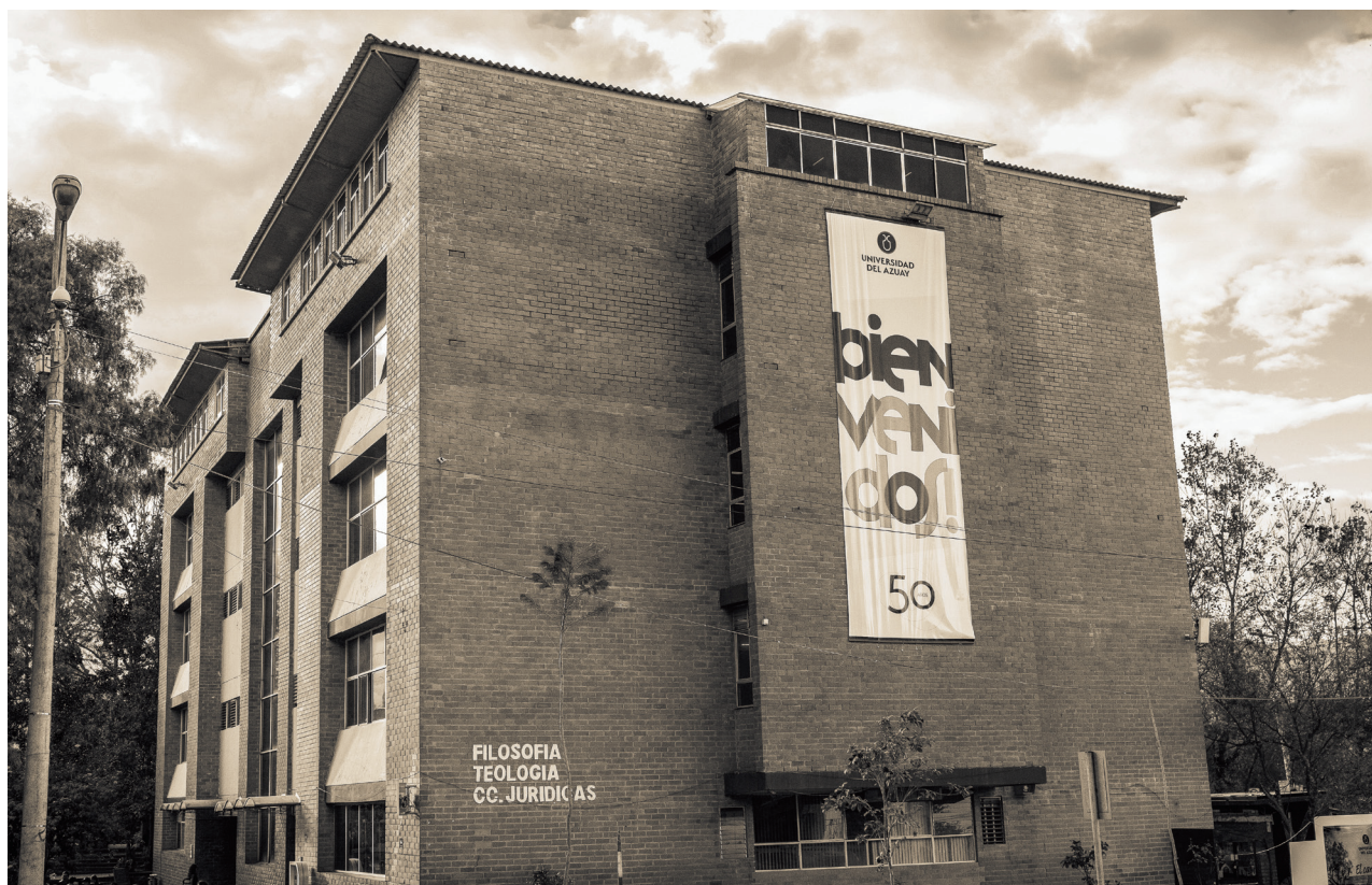
Edificio de la Facultad de Filosofía